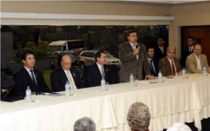
Eduardo Felippo, titular de la UIP, durante el discurso inaugural, junto al presidente Federico Franco y otras autoridades gubernamentales y gremiales.

El Gobierno declara la “guerra” al contrabando y anuncia mayor control -- El Gobierno nacional anunció ayer un combate “total” al ingreso de artículos de contrabando, contra los que traen productos desde Clorinda, Argentina. El presidente de la República, Federico Franco, encabezó una reunión con gremios industriales y pequeños productores, quienes denunciaron los perjuicios que sufren debido a la entrada de mercaderías de manera ilegal.